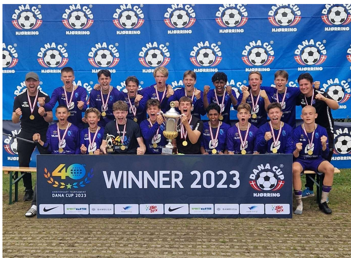
G16 vinner av Dana Cup 2023

Guttene triumf ble sammen med de andre prestasjonene hedret under seriekamp på Varden Amfi like etter sommerferien.