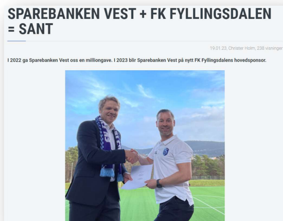
Sparebanken Vest er «tilbake» som ny hovedsponsor

Klubben fikk etter søknader innvilget prosjektmidler fra Sparebanken Vest på til sammen kr. 167 000. Det var også enkeltlag som fikk støtte fra SPV. En rekke av lagene våre i barne- og ungdomsfotballen fikk også tildelinger etter søknader fra Fana Sparebank.