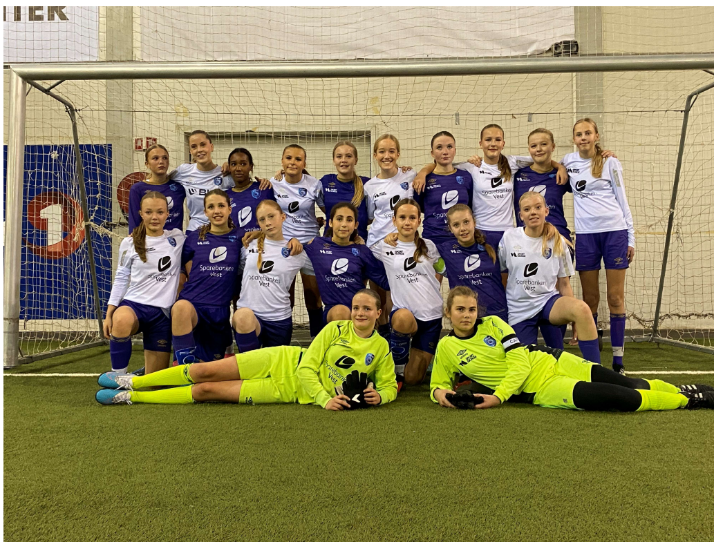
J14 - Kretsmestere