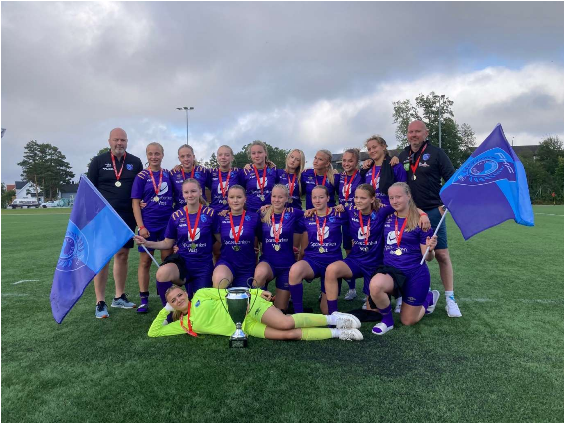
FK Fyllingsdalen J-15/17 - Kretsmestere