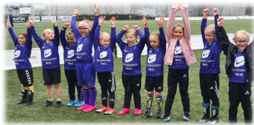
Fornøyde FKF spillere

I 2023 bestod barnefotballen (6-12 år) av ca. 40 lag påmeldt i seriesystemet. Lagene er fordelt på kretser omkring de ulike skolene i nærområdet. Varden skole, Lyshovden oppveksttun, Sælen oppveksttun, Løvås oppveksttun, Bjørndalsskogen skole og Seljedalen skole. Det er også barn fra noen andre deler av Fyllingsdalen. Vi ser en klar tendens der guttelagene kretser omkring skolene, mens jentelagene er samarbeidslag, noe som kan forklares med at det er færre jenter som spiller fotball enn gutter.