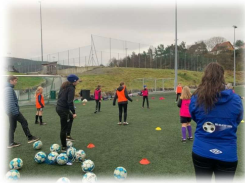
Stor aktivitet og topp motivasjon på Sambafotball

jentegrupper. Formålet er å tilby aktivitet, og det vil derfor ikke bli gitt leksehjelp eller matservering. Hver økt har et fokusområde som trenerne legger opp økten etter. Fokusområder er med på å bevisstgjøre hva målet med økten er, samt at det sikrer variasjon i øktene. Hvert semester avsluttes med konkurranser og premier på den siste økten.