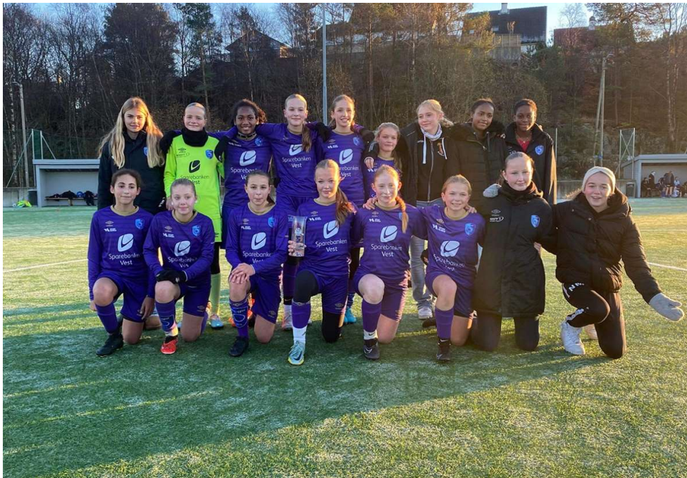
J13 – Krestmestere